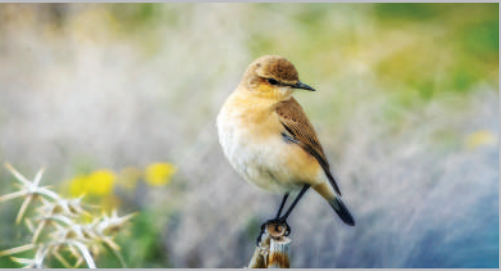
چکاوک بیابانی - پارک ملی بئو