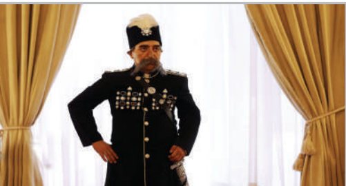
بازگشایی تالار برلیان کاخ گلستان