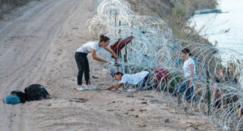
عبور پناهجویان از رود مرزی ریوگرانده بین مکزیک و آمریکا