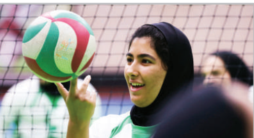
تمرین تیم ملی والیبال نشسته زنان