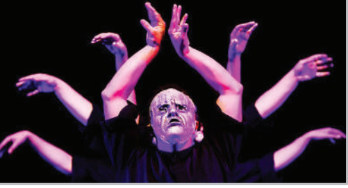
نمایش سیمب، فانوس، کشتی