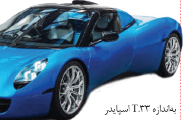
به‌اندازه T.۲۳ اسپایدر

T.۲۳ به‌خودی‌خود سوپراسپرت جذابی است اما گوردون موری با معرفی نسخه اسپایدر، این جذابیت را افزایش داد. پیش‌ترانه ۴ لیتری تنفس طبیعی این ماشین سبک‌ترین موتور ۷۱۲ جاده‌ای جهان است که تنها ۱۷۸ کیلوگرم وزن دارد و با این‌وجود، ۶۱۵ اسب بخار قدرت تولید می‌کند. همچنین از آنجایی که در محصولات GMA (گوردون موری اتوموتیو) لذت رانندگی اهمیت بسیار زیادی دارد، برای T.۲۳ گیربکس اتوماتیک ارائه نمی‌شود تا راننده بهترین عناصر خودروی اسپرت یعنی دیفرانسیل عقب، گیربکس دستی و موتور ۷۱۲ تنفس طبیعی را در یک پکیج داشته باشد. همچنین ظاهر این خودرو هم گذشته را به یاد می‌آورد و بنابراین، کمتری خودرویی را می‌توان